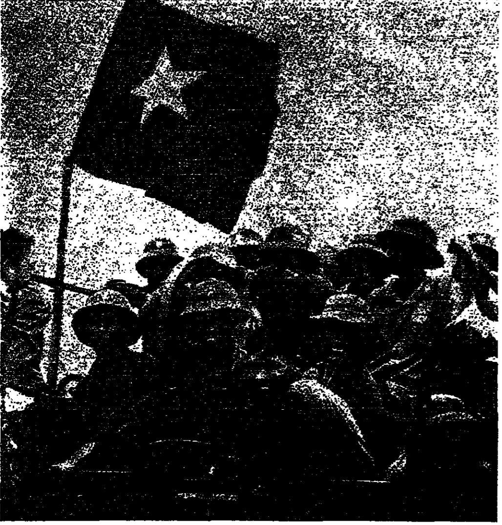
إستبلة النصر على وجوه الشوار

انسان من فهم ٥٦ ألف أمريكي وكان الرئيس فيتنامي الجنوبي دونغ فان مينه الذي لم يعرف مصر على الفور، قد دعا قواته مساء أمس الأول الى وقف القتال، وقال انه مستعد لتسليم السلطة الى «الفيكونغ».